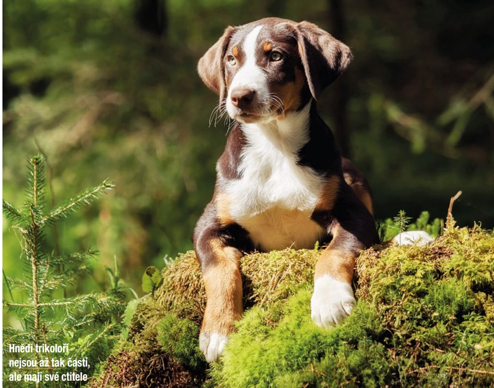
Hnědí trikolori nejsou až tak častí, ale mají své ctitele

Appenzellští salašničtí psi milují pohyb, dlouhé procházky, aportování i plavání. Mají velkou výdrž, proto zvládnou i několikahodinovou vysokohorskou turistiku. Díky své nenáročnosti a houževnatosti jsou skvělými parťáky pro lidi milující pobyt v přírodě. Ovšem kromě fyzické aktivity je neméně důležité jim poskytnout i nějakou psychickou činnost. Tou může být například cvičení základních povelů, různých triků, použití hlavolamů, stopování nebo i kynologické sporty. Pro appenzelly, jak je majitelé sami označují, bývá ale nejdůležitější, když mohou vybranou činnost dělat společně se svým páníčkem. Jsou velmi přizpůsobiví a dokážou se podřídit dennímu režimu svého majitele. Nemusí denně nachodit desítky kilometrů, postačí jim, když se jim jejich člověk dostatečně věnuje přes den. Někteří si libují i ve válení na gauči. Co nemají rádi, to je křik, hádky a celková nepohoda v rodině. „Při výcviku pak dril a časté opakování. Díky své inteligenci považují za zbytečné dělat stejnou věc desetkrát. Velmi strádají při separaci a vyčlenění ze své smečky,“ tvrdí Andrea Steinerová a dodává, že vzhledem k původnímu poslání tohoto plemene jsou appenzellští salašničtí psi výbornými kandidáty na jakoukoliv práci na farmách a statcích, kde se