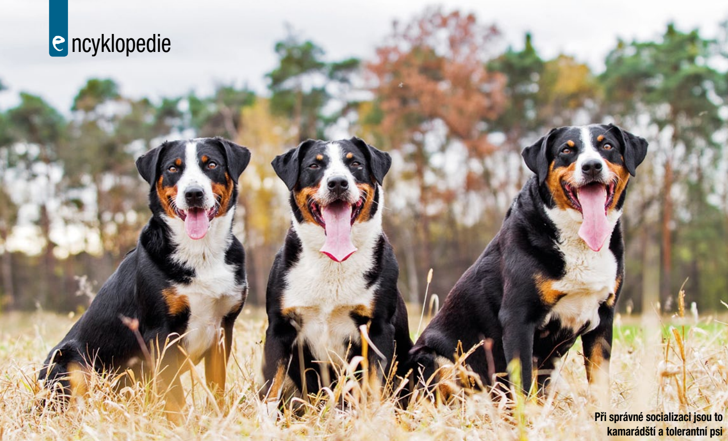
Při správné socializaci jsou to kamarádští a tolerantní psi

páníčka, kterou by rozhodně neměl šetřit. Pokud se ve výcviku něco nedaří, je lepší se vrátit o krok zpět nebo nechat cvik trochu odležet – za den dva totiž může být situace zcela jiná. Spolupráce s člověkem je jim vlastní, i když se v minulosti museli při práci na farmách mnohdy samostatně rozhodovat. „Ve Švýcarsku se používali k hlídání stád skotu, proto se museli spoléhat sami na sebe, na své smysly, tudíž mají svoji hlavu, ale správnou výchovu a pozitivním přístupem se z nich dá vychovat poslušný pes,“ říká Dana Kroupová. Jsou to věrní a pracovití psi, kteří jsou stále připraveni do akce se svým majitelem.